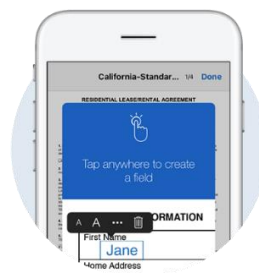
Telefon / Tabletă